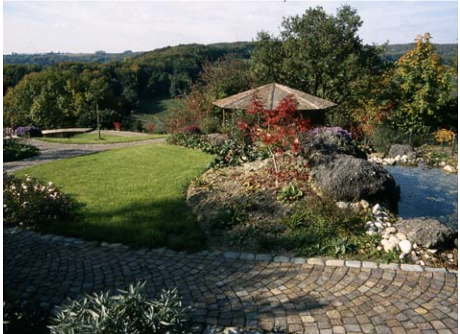
Výškově členitá zahrada nabízí více možností ztvárnění. Dokonce lze výraznější výškové nerovnosti překlenout mostem, jak lze vidět na obrázku v levé zadní části zahrady

Podaří-li se vám vytěžit již při umístění domu z tvaru pozemku maximum, můžete se těšit na další hrátky, které váš soukromý prostor rozvinou do dalších dimenzí. Zkrotit lze i prudký svah. Jen to chce o trochu více invence a odvahy. Hlavním cílem řešení takové situace bude přeměnit co nejvíce šikmé plochy na rovinu, která takovou zahradu vždy pozvedne. Už jenom proto, abyste měli dostatečný prostor na pohodlný pohyb, relaxaci i stolování. Nabízí se zejména vytvoření terasových stupňů, které jsou sice finančně náročnějším, ale mnohem efektivnějším řešením, nehledě na snad-