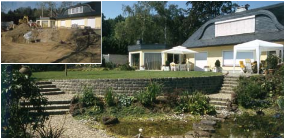
Náročnější terénní úpravy zahrady se neobejdou bez těžké mechanizace a nutnosti přemístění velkých objemů zeminy. Prostředky vložené do úpravy terénu se vyplatí jen tehdy, pokud tyto investice adekvátním způsobem zlepší nejen pohyb a pobyt na zahradě, ale i její údržbu

Z tohoto pohledu je dobré zvážit, zda vám vyhovuje příjemné ranní slunce, které proteplí den již od vašeho probuzení, nebo zda vyhledáváte horké letní paprsky až do pozdního večera. Terasa