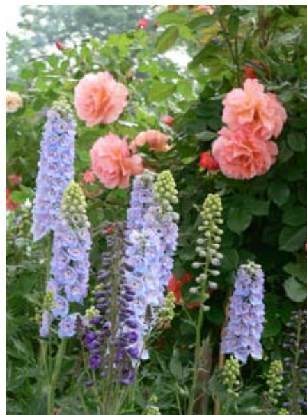
Vyšší keřové růže vynikají v kombinaci s mohutnými trvalkami: na obrázku růže 'Westerland' (W. Kordes Söhne, ADR 1974) vedle modré stračky ( Delphinium )

Velkokvěté růže, tzv. čajohybridy, jsou slavné zejména díky dokonalému tvaru a velikosti pupat, barvě a omamné vůni. Primát ve šlechtění těchto růží patřil