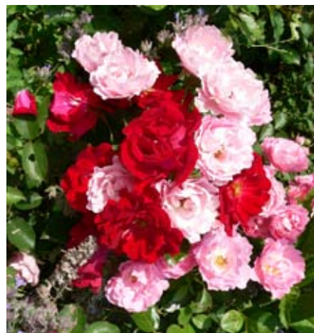
Dva kultivary na obrázku řadíme do skupiny půdopokryvných růží. Růžová 'Sommerwind' (ADR 1987) a červená 'Sommerabend' (ADR 1996) patří k tomu nejlepšímu

M inulý díl našeho seriálu zavítal do pestrého světa trvalek. Tentokrát věnujeme netradičně celý samostatný díl pouze jedné rostlině, která si to ale rozhodně zaslouží. Královna květin a zahradní poklad v jednom: růže. Pojďme společně nahlédnout do voňavého a barevného světa trnitých krasavic, které mají nesčetné podoby a jsou na zahradách zcela nenahraditelné.